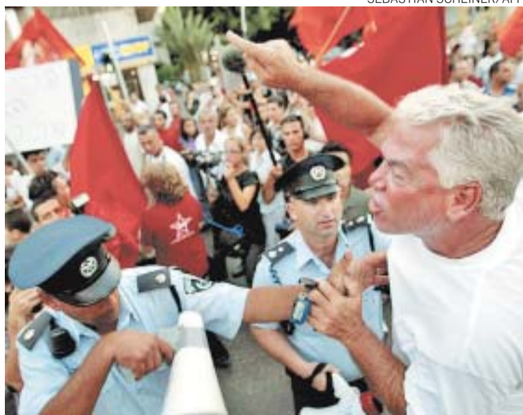
TENSÃO - Israelense acusa marcha de pacifistas de traição ao país

Os organizadores do evento exigem que o Exército suspenda imediatamente as operações no Líbano e Olmert negocie com o Hezbollah a devolução dos dois soldados israelen-