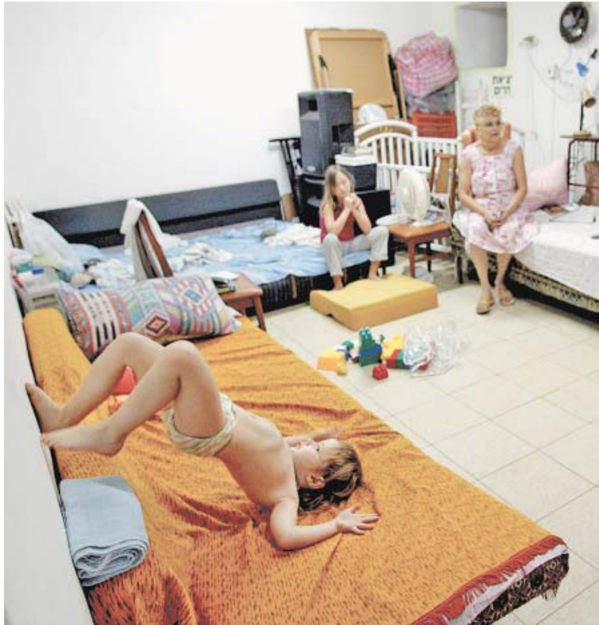
NOVA ROTINA - Criança brinca em abrigo israelense em Kiryat Shmona, perto da fronteira do Líbano

“Tenho certeza de que, aos poucos, o povo vai se dar conta do crime que país está cometendo no Líbano”, acredita o sobrevivente do Holocausto nascido na Polônia Efraim Horman, de 82 anos, que participou da passeata levando um cartaz em inglês com a frase “Pare com essa guerra agora”. “Tenho vergonha da cúpula política deste país”, acrescentou. ●